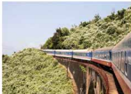
TIN TỨC Tuyến đường sắt VN lọt Top đẹp nhất TG