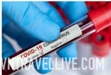
TIN TỨC Kháng thể vô hiệu hóa virus gây Covid- 19