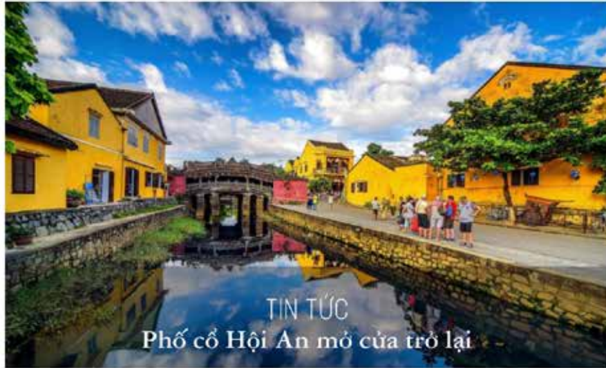
TIN TỨC Phố cổ Hội An mở cửa trở lại